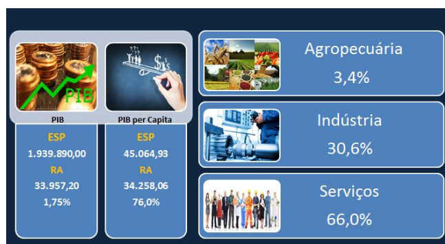
PIB / PIB per Capita / Valor Adicionado

A agroindústria tem uma importância expressiva na economia regional, sobretudo as atividades relacionadas às cadeias produtivas de laranja, cana de açúcar e frango, além da forte presença do setor industrial. Os três maiores produtores e exportadores de suco concentrado de laranja do mundo possuem unidades industriais na região, distribuídas entre os municípios de Araraquara, Matão, Taquaritinga, Itápolis e Porto Ferreira.